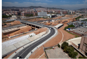
Vista aérea de la zona de La Sagrera

Adif Alta Velocidad abonará un total de 6.875.000 (IVA excluido) del coste total de la obra, que ha ascendido a 9.573.996 euros (IVA excluido), según los acuerdos alcanzados entre Adif y la sociedad Barcelona Sagrera Alta Velocidad en 2009.