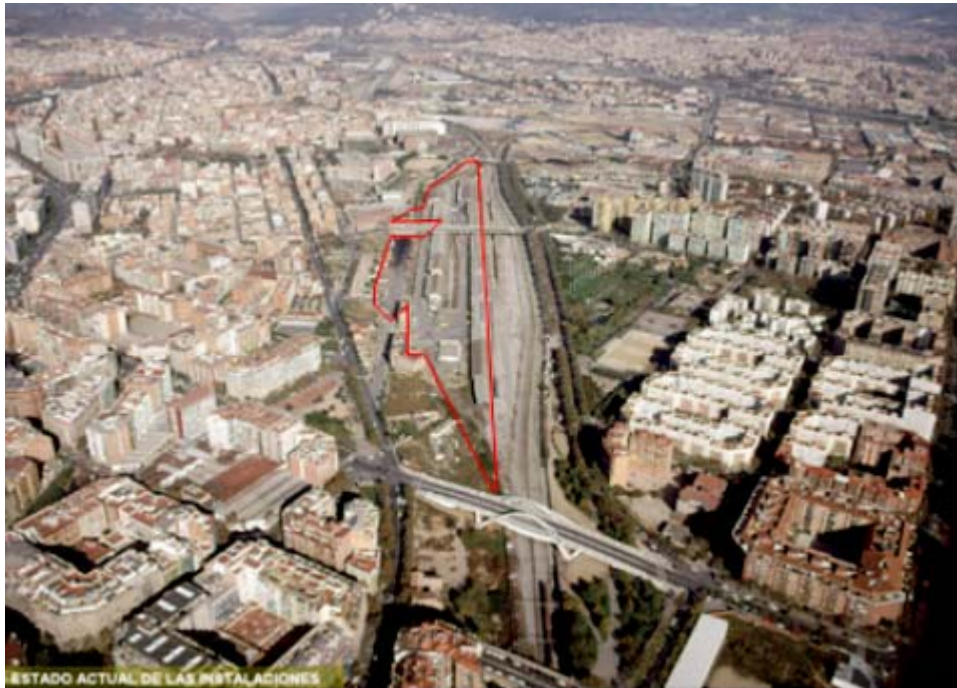
Vista general de l'estació de mercaderies a deconstruir

L'antiga estació de mercaderies de la Sagrera té una superfície de 123.500 m 2 i està situada entre el Pont de Bac de Roda i el Pont de Sarajevo al districte de Sant Andreu. Aquesta estació està formada per 30 edificis amb una superfície construïda total de 38.800 m 2 . La majoria dels edificis estan actualment en desús.