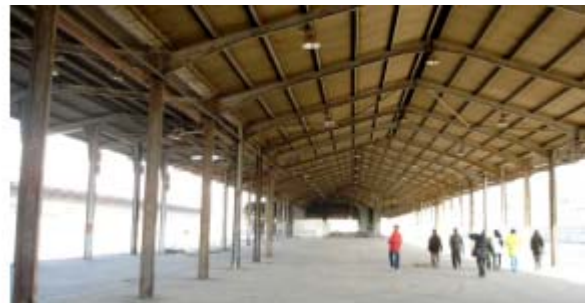
Imatges de les instal·lacions a enderrocar