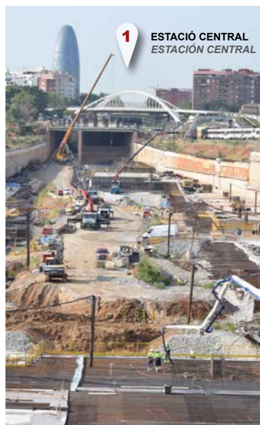
1 ESTACIÓ CENTRAL ESTACIÓN CENTRAL

El conjunto quedará cubierto por un gran parque de 40 hectáreas, con nuevos equipamientos y servicios públicos.