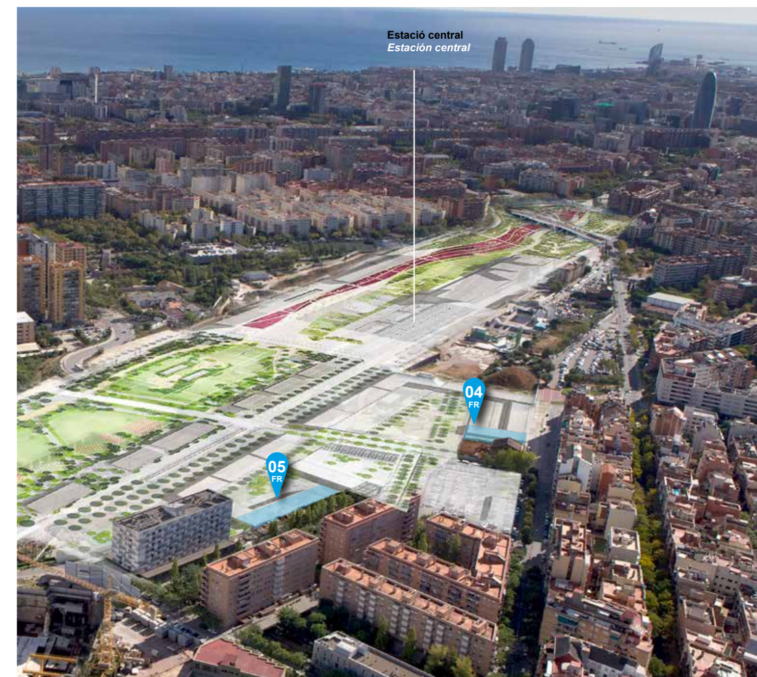
Estació central Estación central