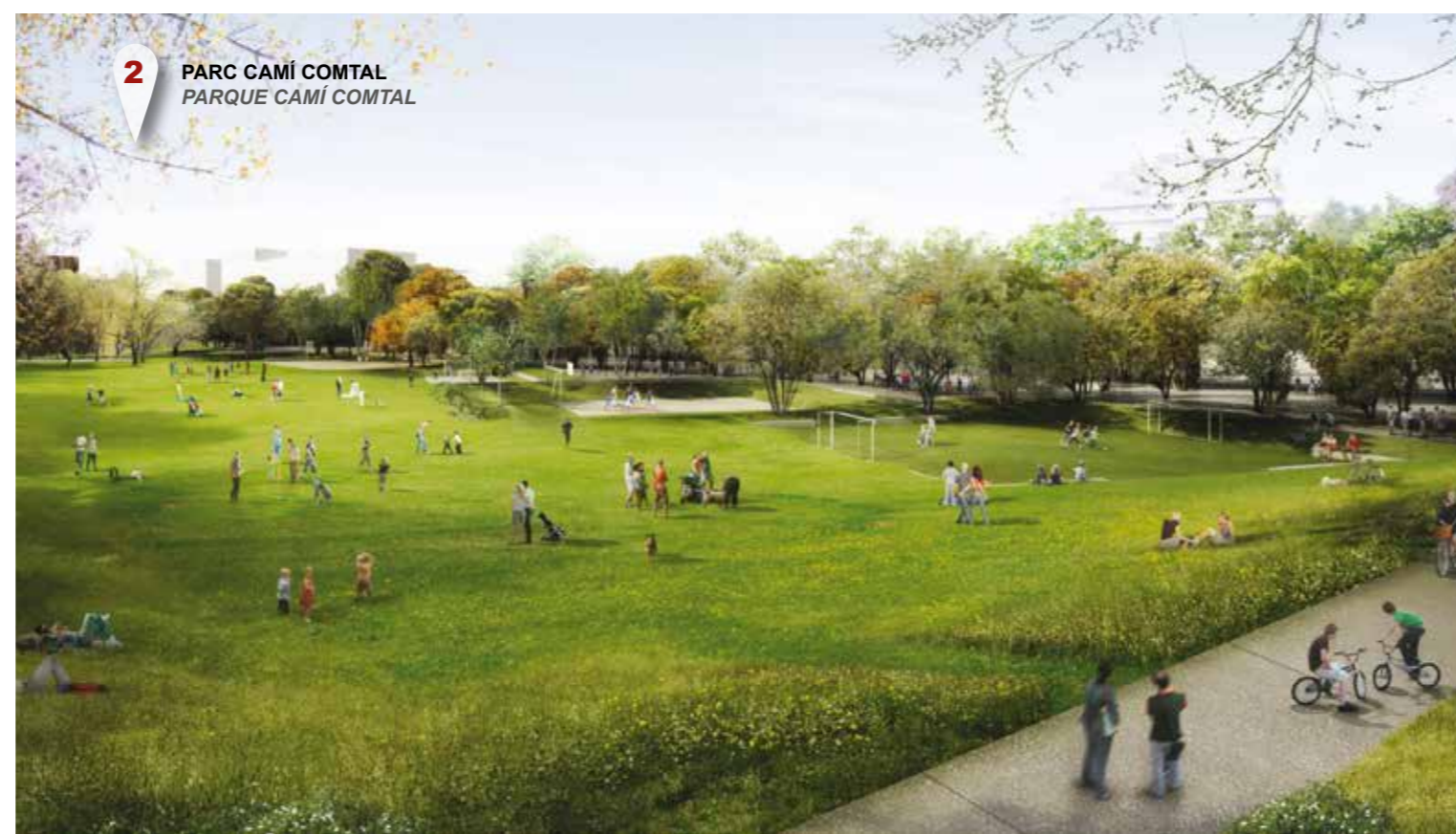
2 PARC CAMÍ COMTAL PARQUE CAMÍ COMTAL