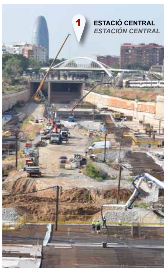
1 ESTACIÓ CENTRAL ESTACIÓN CENTRAL

El conjunto quedará cubierto por un gran parque de 40 hectáreas, con nuevos equipamientos y servicios públicos.