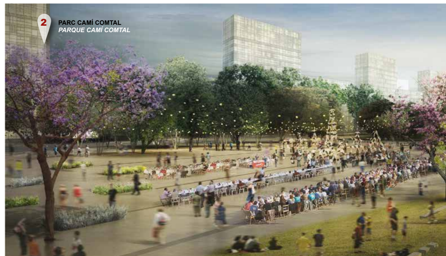
2 PARC CAMÍ COMTAL PARQUE CAMÍ COMTAL