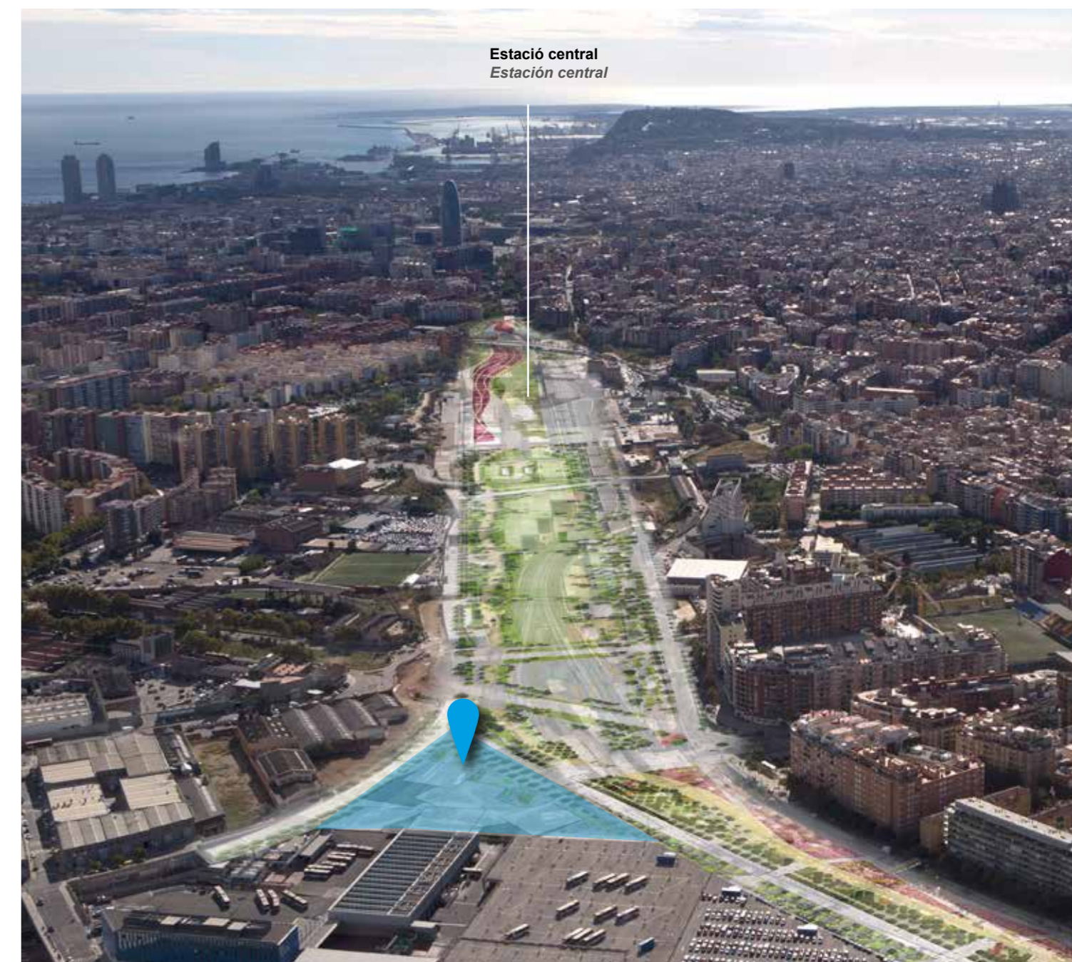
Estació central Estación central