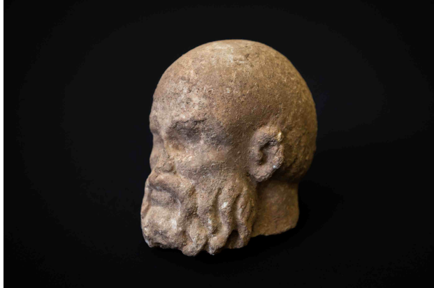
Foto del cap de Silè de la vil·la romana de la Sagrera.