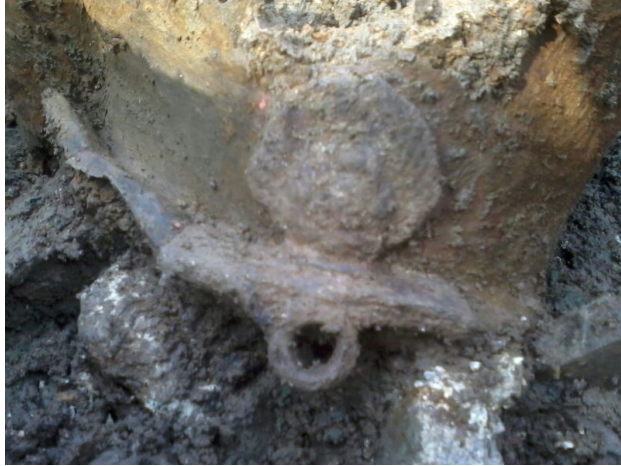
Detall de la sítula.