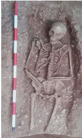
Fossa d'inhumació romana del segle I aC.

Dins dels treballs d'urbanització relacionats amb el projecte de rehabilitació i ampliació de l'edifici situat al número 52-62 del carrer de Berenguer de Palou (Barri de la Sagrera, districte de Sant Andreu), conegut com a Torre de la Sagrera, s'ha realitzat una excepcional troballa que àmplia el coneixement de la història de Sant Andreu en època romana.